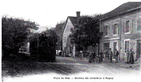
Pays de Gex. — Station du tramway à Segny