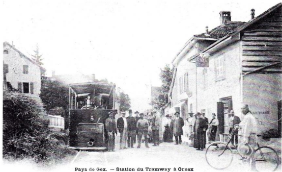
Pays de Gex. — Station du Tramway à Ornex