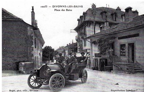
Bogat, phot.-édit., Divonne