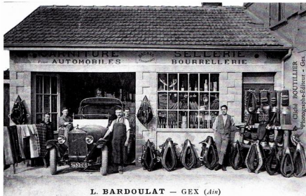
L. BARDOULAT — GEX (Ain)

Exemple de transition : vente d'articles de cuir pour attelages et réparation de voitures automobiles.