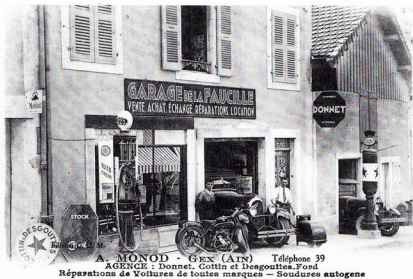
Le garage Monod en 1926, Agence Donnet puis Simca, fermé en 1955. A droite, Arthur Monod, à gauche Louis Godet.

Exemple de transition : vente d'articles de cuir pour attelages et réparation de voitures automobiles.