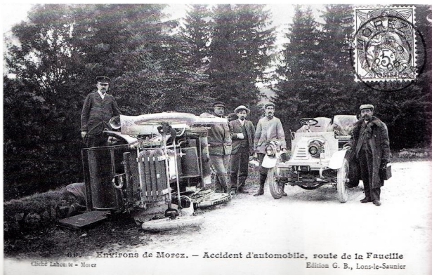
69. — Environs de Morez. — Accident d'automobile, route de la Faucille

Excès de vitesse ou défaillance mécanique ?