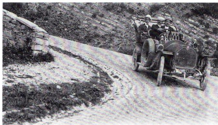
10067 — De Gex au Col de la Faucille — A la Fontaine Napoléon — Virage dangereux